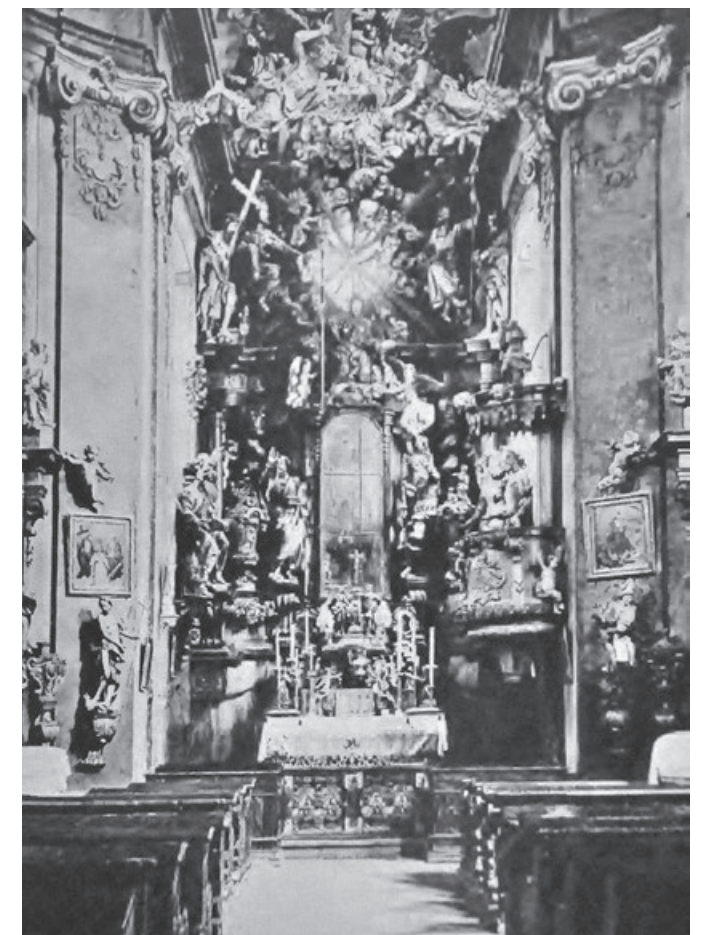
A. Podlaha: vnitřek kunratického kostela (1908)