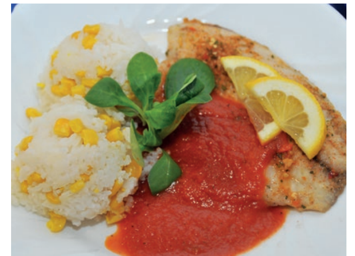
Pečená tilapie na bylinkách s pomodoro omáčkou a jasmínovou rýží s máslovou kukuřicí

velké stroje máme, například 3 konvektomaty, tlakové pánve, kotle. Ale když už se mě ptáte, tak by se mi líbilo mít ještě velké chladicí boxy. Jinak je tu ale kuchyně vybavená velmi dobře.