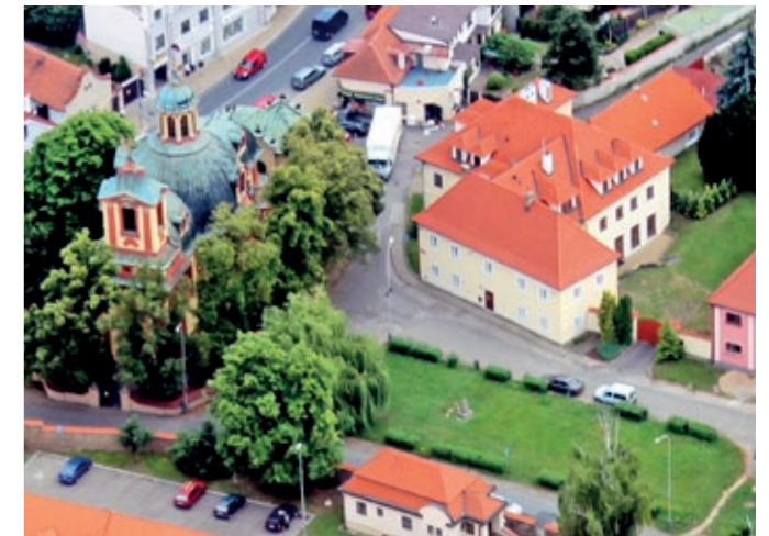
Letecký snímek náměstí z roku 2013.