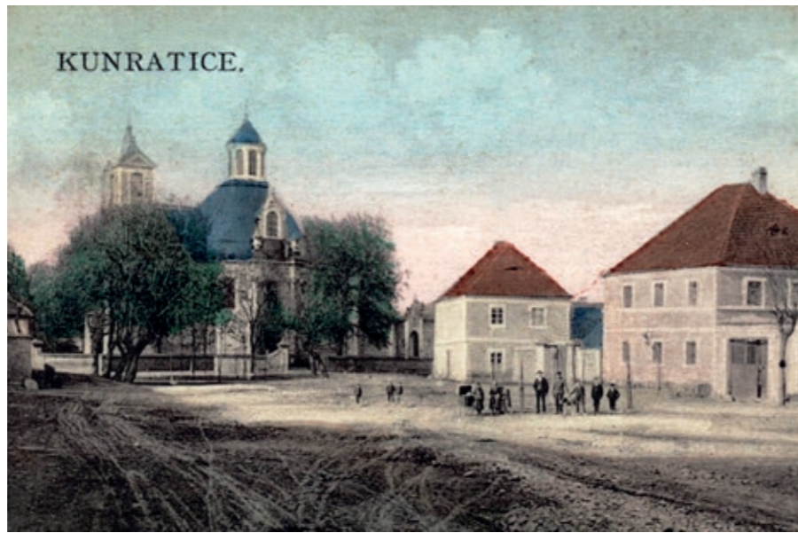
Kolorovaná pohlednice z počátku 20. století

Mapa stabilního katastru z roku 1841 znázorňuje prostor dnešního Kostelního