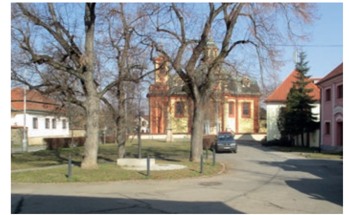
Kostelní náměstí 8. března 2025.