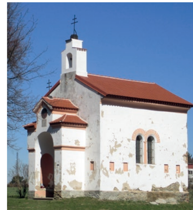
Zdiměřická kaple s novou taškovou střechou.