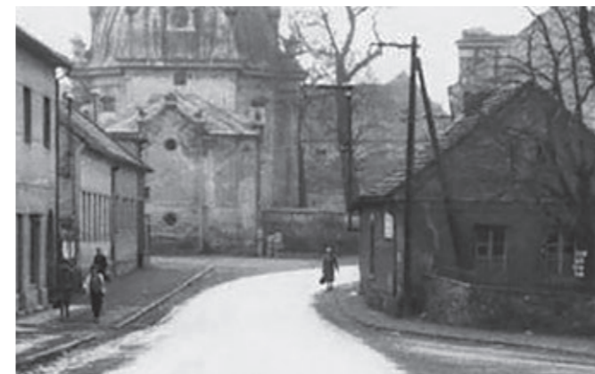
Průjezd kolem hrobky na Kostelním náměstí (1961).