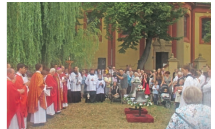
Svěcení dvou nových zvonů 28. července 2015.