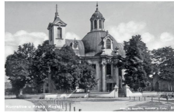
Kostelní náměstí v roce 1930

Proměny náměstí ve 20. století a prvním čtvrtstoletí 21. století si můžeme nejlépe připomenout na několika fotografiích. Na pohlednici z roku 1930 je již zřetelně vidět Golčova ulice a cesta podél kostelní zdi s postranním vchodem. Je vykolíkováno prostor budoucího trávníku, který bude oddělovat od komunikací výsadba keřů a okrasných stromů. Černobílá fotografie z roku 1983, pořízená z lešení při opravě kostela, naproti tomu představuje zeleň na náměstí poněkud bujnou. Zato na leteckém snímku z roku 2013 není pro rozrostlé stromy zase skoro vidět kostel. Přerostlý „kaštan“ těsně u kostela v ulici K Libuši již začínal poškozovat fasádu budovy, a byl proto roku 2014 poražen. Ostatní přerostlé stromy včetně mohutné vrby pak byly v následu-