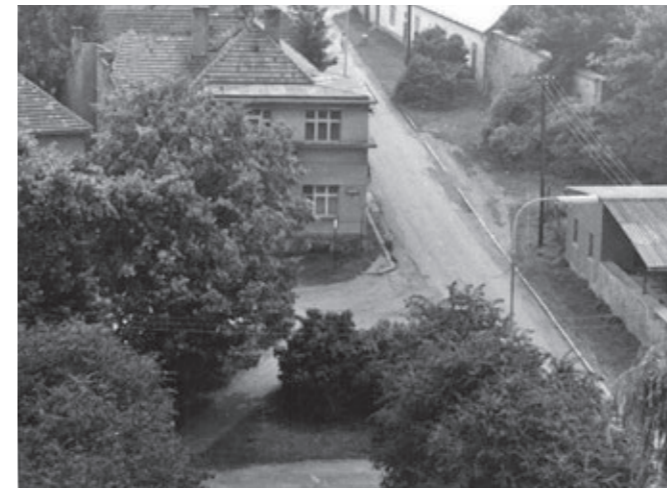
Horní část náměstí v roce 1983.