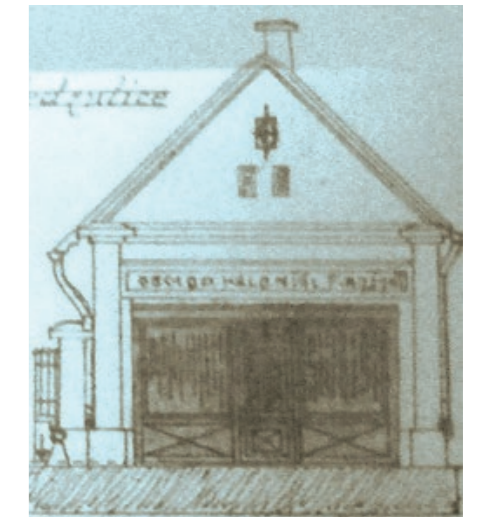
Nákras přestavby domku č. p. 3 z roku 1923