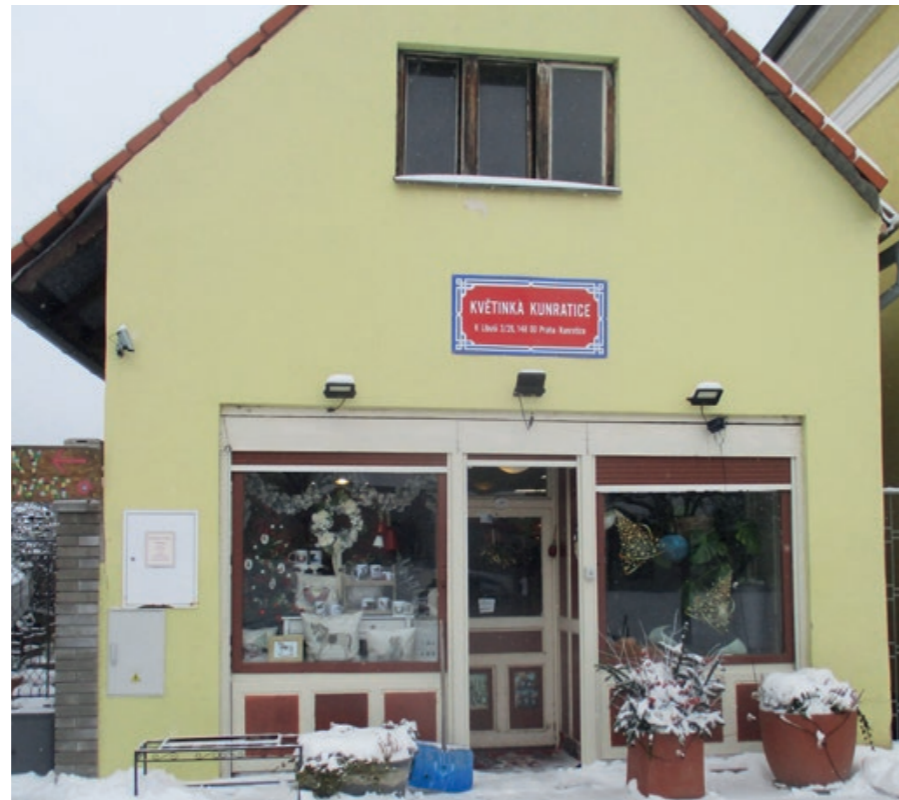
Prodejna Květinka leden 2026