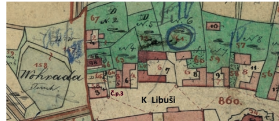
Mapa Stabilního katastru z roku 1841

se učili v první třídě psát, je dnes vyhledáváno sběrateli anebo těmi, kteří si rádi vychutnají i dnes psaní dopisu perem, namáčeným do inkoustu. Pro pero jsme ale měli i jiné použití. Lavice ve škole byly z měkkého dřeva a nástroj ke psaní sloužil dobře jako oštěp, který se tak krásně do lavice zapichoval. Pak ovšem bylo „pérko“, rozskřípané, ke psaní nevhodné. Bylo nutné se stát zákazníkem krámků vedle školy.