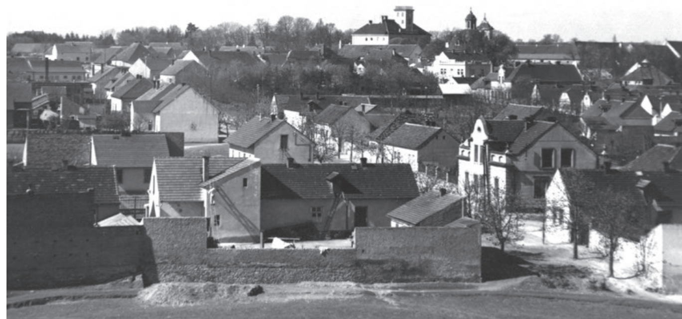
Pohlednice z Kunratic u Prahy asi roku 1935, foto ze skály.

tak oblíbený výhled na Kunratic. Motivy pohlednic z prvních šedesátí let dvacátého století jsou podle fotografií ze skály.