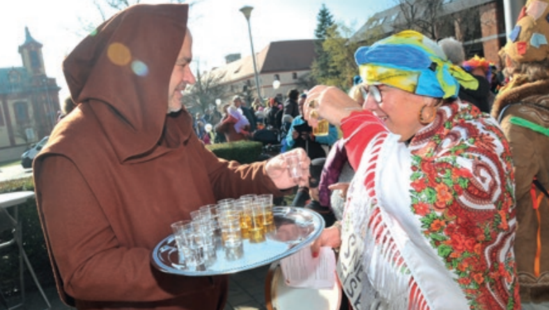
Masopustní veselice v Kunraticích