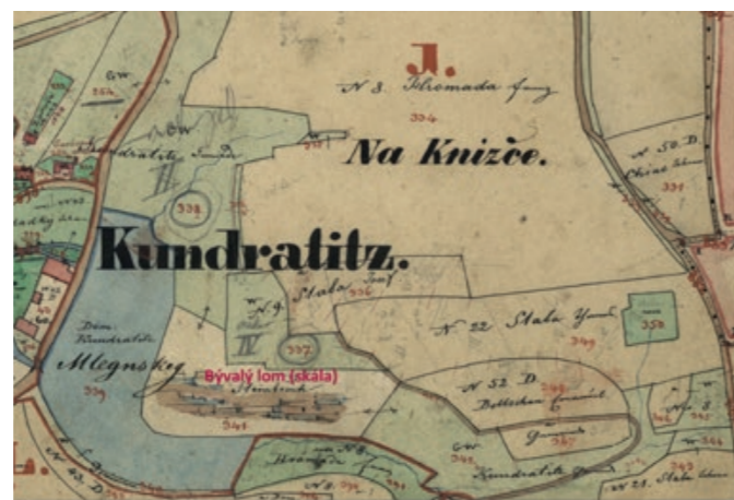
Mapa stabilního katastru z roku 1841

Název ulice je odvozen od polohy u nedalekého rybníka. Ulice dostala svůj název v roce 2007. Část ulice byla v roce 2011 přejmenována K Chodovu.