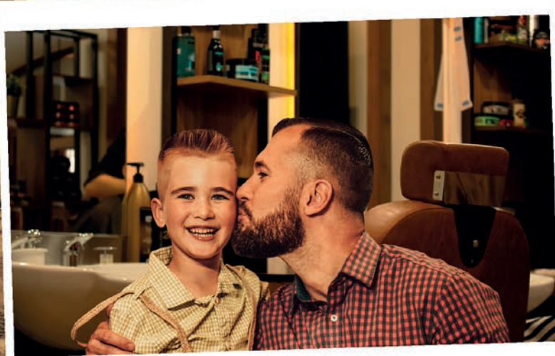
poprvé s tátou v barber shopu