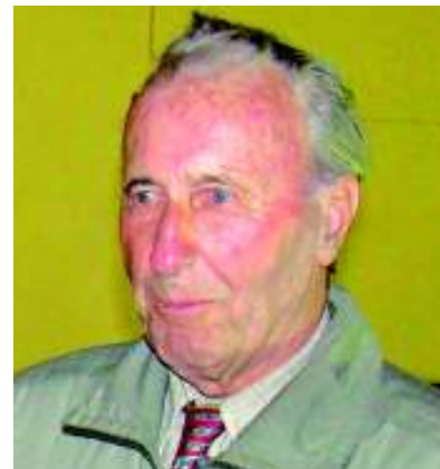
Na návštěvě Kunratic roku 2010.