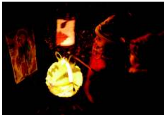
Na skřítky si musíte posvítit.

V rodinném centru U Motýlků bylo 15. listopadu v podvečer velice živo. Přišlo 72 dospělých a 105 dětí, aby se zúčastnili druhého ročníku výletu do země pohádkových skřítků.