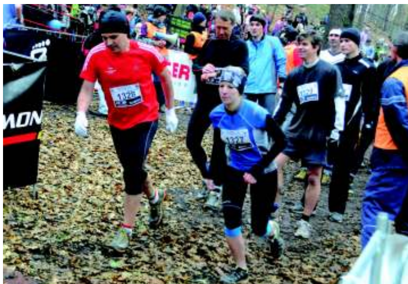
Společný start mužů a žen.

Roku 591 n. l. byzantský král Mauricius bojoval s Římskou říší v oblasti Thracie. Zde zajal tři Slované. Mauricius v úžasu zjistil, že Slované nejsou ozbrojeni a nosí s sebou jen tambury. Překvapeně se ptal, kdo jsou a cože to mají v rukou? A oni odpověděli: „ My jsme Slované a my žijeme podél Západního moře (Jadranu). My hrajeme na tambury, protože u nás není žádné železo, my žijeme v míru. My neznáme význam válečných polnic. “ Přenesme se ale o několik století do současnosti na náš koncert. Hosté zahájili vystoupení Znělkou pražských tamburašů od Čestmíra Šteffka a pokračovali programem se širokým záběrem. Návštěvníci si vyslechli polku Veselá plesačica, Pláč Židů z opery G. Verdiho Nabucco, směs písní Karla Hašlera Hašlerky, valčíkové melodie Johanna Strausse, pochod Karla Vacka Zůstaň tu s námi a mnoho dalších skladeb rozličných autorů a žánrů. Přítomní se tak mohli přesvědčit, že na tamburašské nástroje se dá zahrát téměř vše. Koncert se líbil, a proto závěrem nechyběl velký potlesk. Pokud by se chtěl některý muzikant k Pražským tamburašům připojit, tak soubor hledá hráče na mandolinu berde. Nástroj, který svou velikostí připomíná basu. (my)