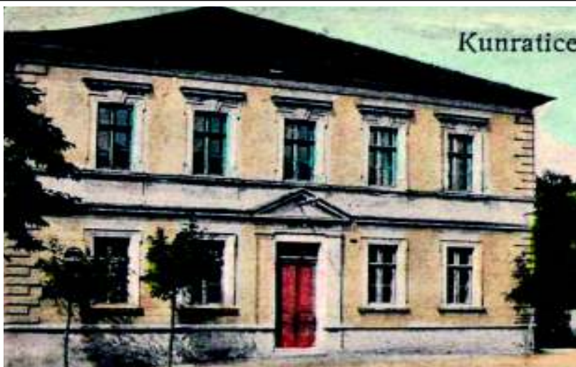
Budova školy na pohlednici přibližně z 20. let minulého století.

Budova obecné školy v ulici K Libuši č. p. 57, postavená podle plánu ing. Hattmanna, byla otevřena a vysvěcena 29. září 1885. Měla původně čtyři třídy a byt pro učitele. V období I. světové války sloužila v letech 1915–1916 jako vojenský lazaret. Po otevření nové školy v dnešní ulici Předškolní 1. září 1935 se převážně využívala pro výuku dětí od 1. do 5. třídy. V průběhu Pražského povstání roku 1945 se budova stala prozatímním vězením 89 občanů Chodova, kteří zde byli drženi jako rukojmí. Událost připomíná pamětní deska na budově. Škola často sloužila i příjemnějšímu ubytování. Během všesokolských sletů nebo pozdějších spartakiád, které se konaly vždy začátkem července, zde bývali ubytováni mimopražští cvičenci. Roku 1982 byla zahájena výstavba pavilonů a tělocvičny vedle budovy základní školy v Předškolní ulici a po jejich dokončení byly učebny ve „staré škole“ uvolněny pro