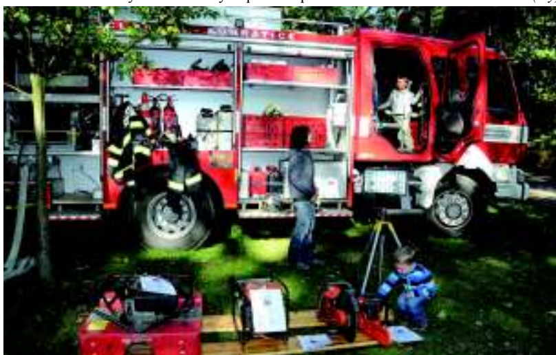
Budoucí Hasiči Kunratice si prohlížejí vybavení současných.