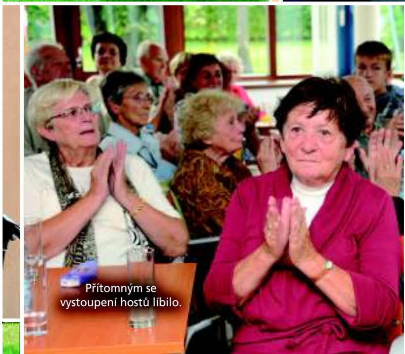
Přítomným se vystoupení hostů líbilo.