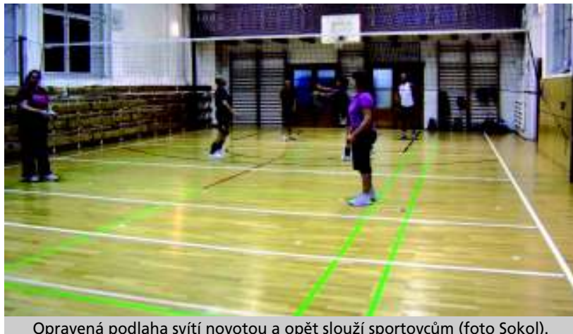
Opravená podlaha svítí novotou a opět slouží sportovcům.