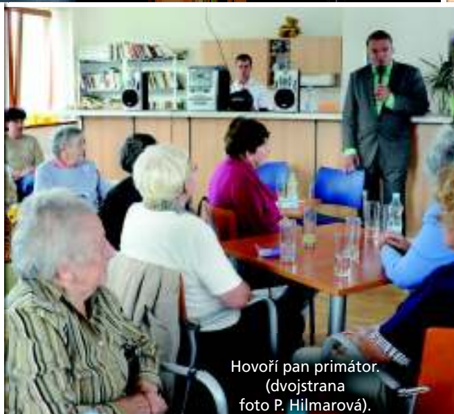
Hovoří pan primátor. (dvojstrana foto P. Hilmarová).