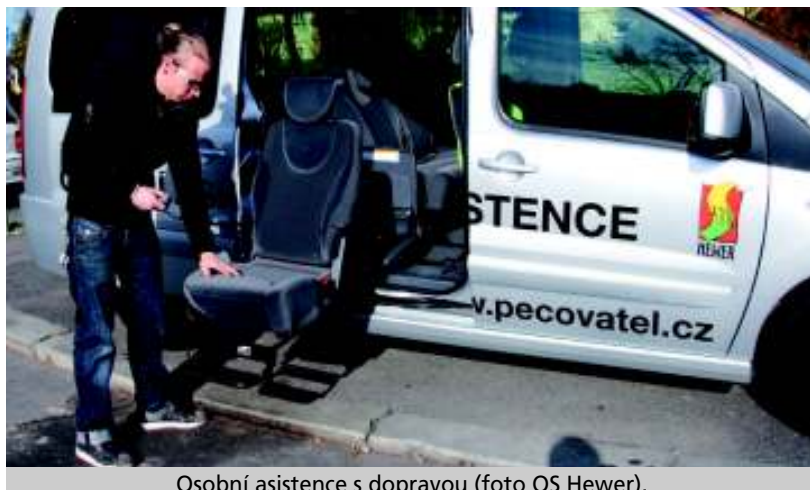
Osobní asistence s dopravou.

První pokus s „Kafe Na Dně“ byl z dnešního pohledu sice zábavný až úsměvný, ale v žádném případě vydělávající. Už v prvním půlroce jsme pochopili, že jen z kávy může být člověk hlavně potěšen, ne však živ (v našich podmínkách tedy). Druhá velká oprava na sebe nenechala dlouho čekat a my v druhém roce zásadně opravili naši budou, vybavili nově celé zázemí a doplnili zahrádku o nové stoly a židle. Postupem času se nám dařilo přesvědčit širší okolí, že to opravdu myslíme vážně. V následujícím roce jsme obnovili beach-volejbalové hřiště a doplnili pétanque, v zadní části areálu vybudovali dětský koutek, zpřístupnili zadní lesík a rozšířili travnatou pláž o další část. Po vybudování mol na sezení u vody a nové cesty ze zámkové dlažby se nám podařilo povýšit areál Šeberák na zajímavé místo, kde nemusí lidé trávit jen letní čas u vody, ale