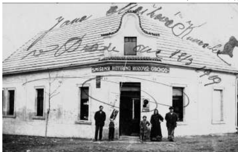
Obchod na rohu ulic Velenická a Ploučnická na pohlednici z roku 1919.