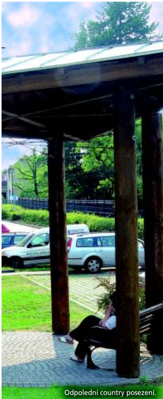
Odpolední country posezení.