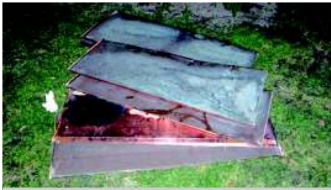
Ukradené měděné plechy z parapetů.

Poslední únorovou neděli večer zadrželi kunratičtí strážníci trojici mužů ve věku 22 až 34 let. Dva Pražané a jejich moravský