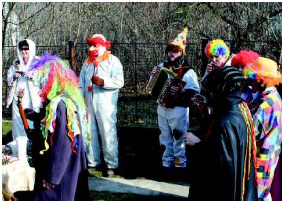
Zastávka masek na „občerstvení u hospodyně a hospodáře“.

Na přípravě knihy se podílela řada spolupracovníků z jednotlivých států Unie všech věkových kategorií. Vybrat a pře-