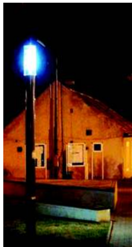
Jsme ve 21. století a pomalu si zvykáme.

Osvětlení pracuje přibližně šest hodin denně. Elektřina vyrobená ve dne z fotovoltaických článků proudí do solárních