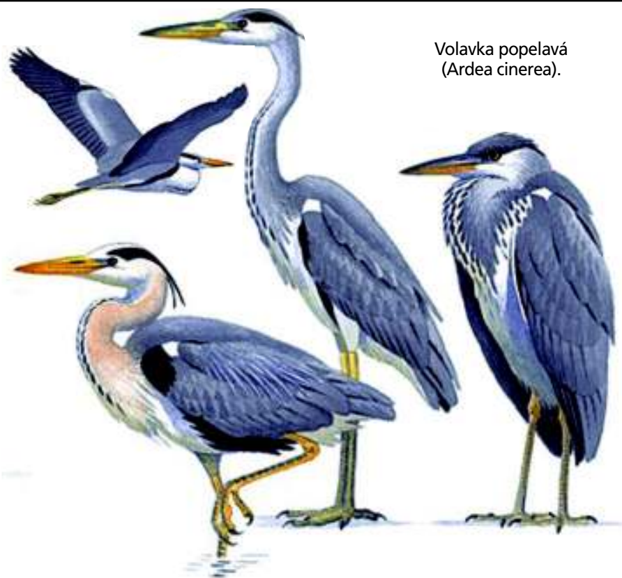
Volavka popelavá ( Ardea cinerea ).

přísňého certifikátu FSC (Forest Stewardship Council), který je uznáván i ekologickými organizacemi v ČR (včetně Hnutí Duha, Greenpeace apod.) a který má v ČR pouze pět vlastníků lesa, což jasně dokládá jeho výjimečnost, a to i z pohledu celorepublikového. Jedině řádná a odborně opodstatněná péče o lesy totiž zajistí trvalost a udržitelnost lesů i v extrémně zatíženém prostředí Prahy, kde se střetává mnoho různých vlivů, požadavků a nároků na lesní prostředí. Zachování a podpora mimoprodukčních funkcí lesů (tj. funkce rekreační, ekologické, hygienické apod.) je ale hlavním cílem všech prací, prováděných v pražských lesích. Proto se již v jarních měsících můžeme těšit na stovky nově vysazených stromků řady druhů, a to i v bezprostředním okolí Kunratic.