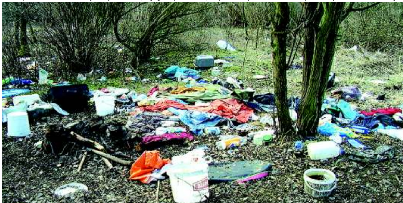
Jarní nepořádek u Kunratické spojky v „rybízech“.