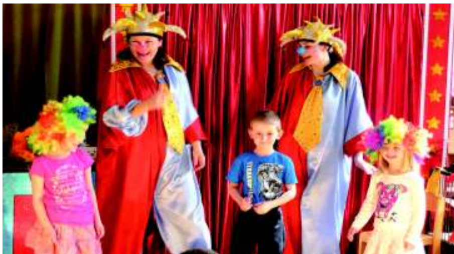
Děti kouzlí s Adonisem (foto my).

másle. Z původně prázdné klece lze vytáhnout bílé králíky, šátky změni barvy nebo se navzájem sváží. No a nechybí