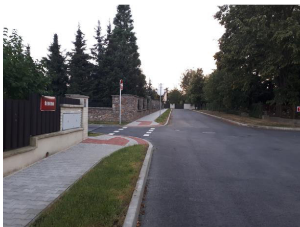
Obrázek 2 - Průkaz funkčnosti i menší plochy zeleně (šířka 1,15 m)

V souvislosti s dlouhodobou snahou řešit odvodnění srážkových vod na místě, především pomocí zasaků do stávající zeleně a díky klimatickým podmínkám, které zvláště v poslední době prokázali vhodnost existence městské zeleně která na rozdíl od rozlehlých asfaltových, či betonových ploch teplo pohlcuje a nezvyšuje tak teplotu ve svém okolí byl návrh zpracován s co největším ohledem na tyto zkušenosti, proto návrh obsahuje plochy městské zeleně.